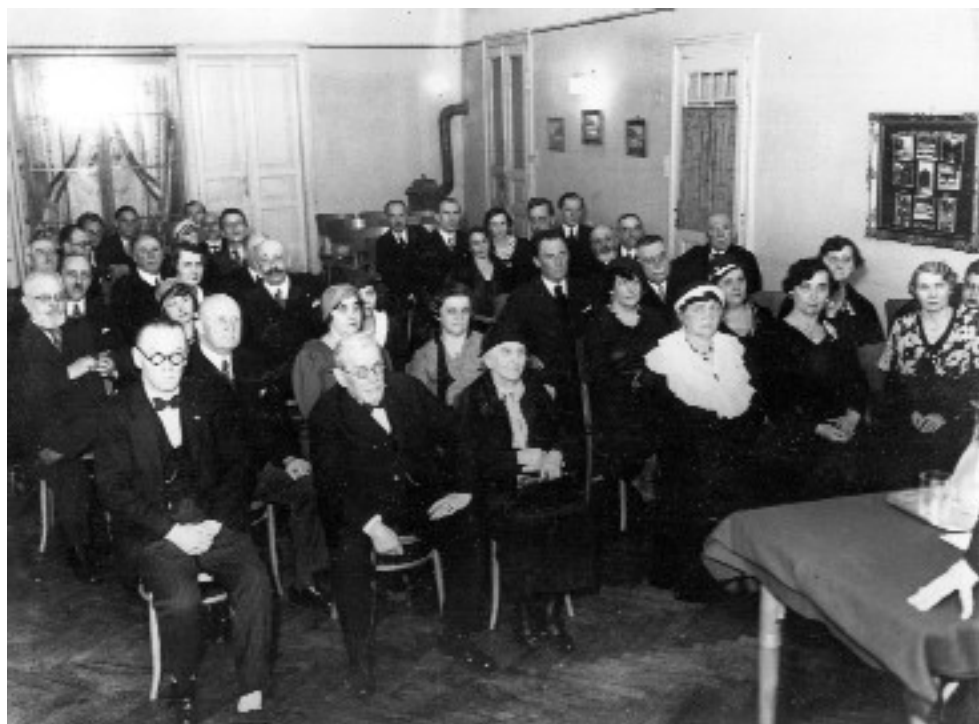
Március 15-i ünnepség 1934-ben, az Erzsébetvárosi Katolikus Körben