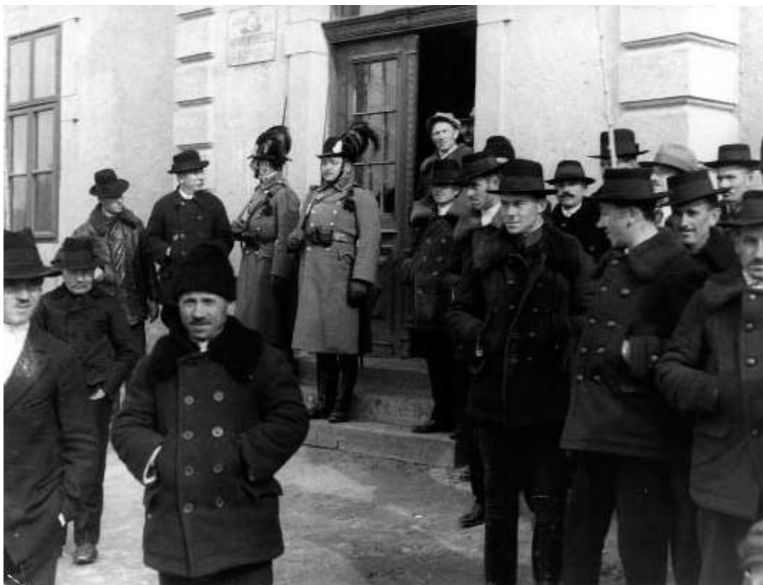
Csendőrök a választási helyiség előtt, Tura (1935)