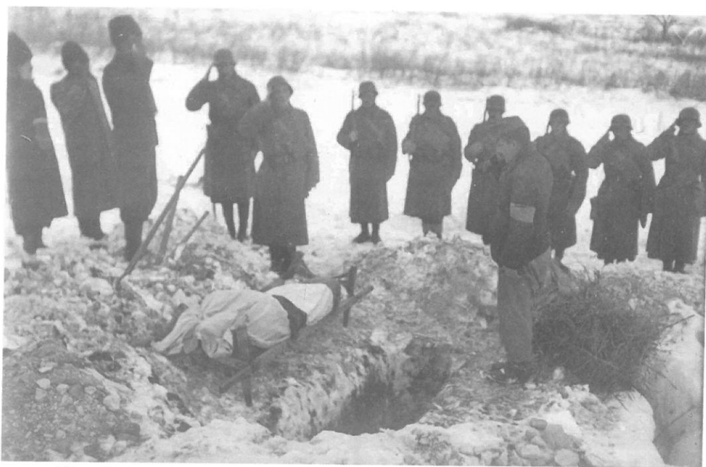
Elesett bajtárs temetése a miskolci 13. honvéd gyalogezrednél

Írhatnánk ezzel, hogy számvetésünk megtörtént, mivel a magyar hadtörténetírás már alaposan feltárta a magyar 2. hadsereg történetét, emlékművek hirdetik az „áldozatok” neveit. A Donnál nemcsak honvédek és munkaszolgálatosok tízezrei veszttek oda, de ami egy katona számára ugyanilyen fontos, ottmaradt a becsületük is. Hetven esztendő óta egyetlen magyar kormánynak sem volt bátorsága ahhoz, hogy erkölcsi kárpótlás gyanánt kimondja azt, amivel sokak lelki sebeire tudna gyógyírt adni: bár a vesztes oldalon álltunk, nagyapáink becsülettel, hősiességgel megállták a helyüket!