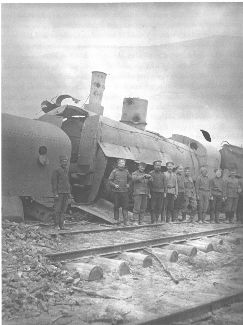
Húsvéti barátkozás az oroszokkal egy szétlőtt páncélvonat előtt, Olyka, 1916