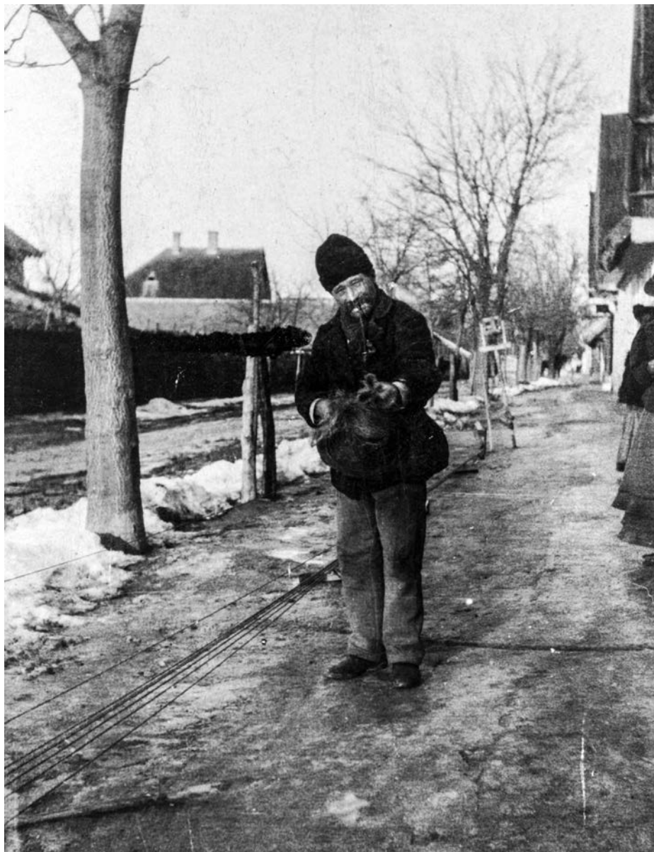
Kötélfonó, Apatin, 1907 előtt (Néprajzi Múzeum, F 8487)

mint a Kádár-kori nosztalgia megjelenése – jelenti éppen e félig befejezett integráció magyarázatát. Az 1973-as válság nyomán, majd a rendszerváltozást követően elszaladó infláció, a növekvő munkanélküliség, a szocialista állam zárt (ál-)biztonságérzetének megszűnése eredményezhetett ilyesféle nosztalgiát.