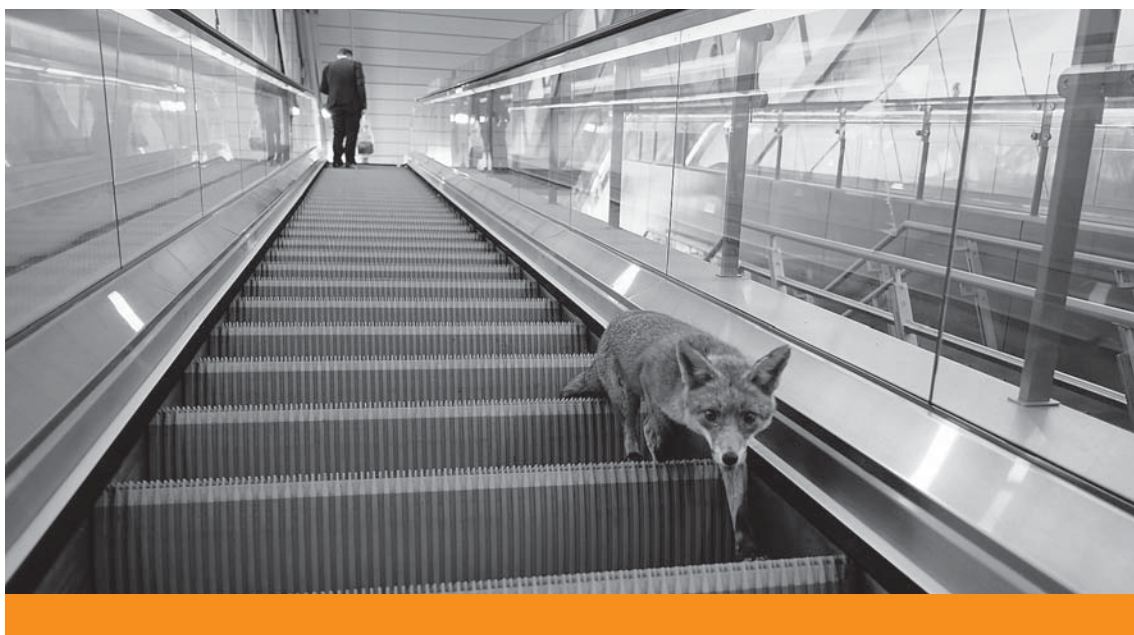
Városi dzsungel – Róka a londoni metróban, 2018. május