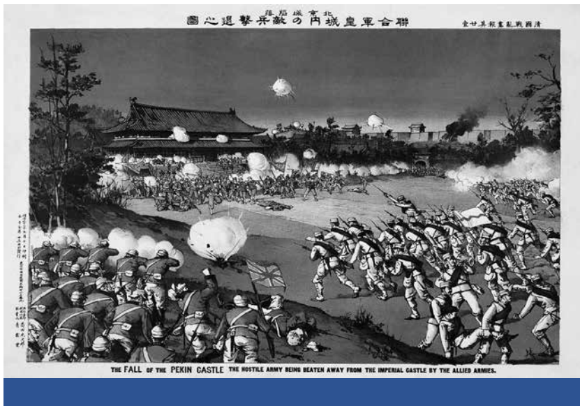
Kultúrák harca – Peking ostroma a boxerlázadás idején (Torajirō Kasai, 1900)

kintették. A civilizáció fogalmában rejlő univerzális és plurális jelentéstartalmak közötti vékony határra, illetve az egyetemes civilizáció egyetemességének nézőpontfüggő jellegére egészen friss példát is találunk. A már említett nyugati katonai akciót követően Bassar al-Dzsafari, Szíria ENSZ-nagykövete felszólalásában Fukuyama és Huntington idézett könyvei kapcsán azt mondta: ezek a művek a hidegháborút követően Amerika azon üzenetét jelezték, miszerint a világ országai vagy követik az amerikai utat, vagy meg lesznek támadva általa. 15 Al-Dzsafari tehát nem látott különbséget az egyetemes és a nyugati civilizáció terjeszkedése között, pontosabban nyugati terjeszkedésként tekintett az egyetemes emberiség eszményére, mintegy csatlakozva ezzel Trubeckoj fentebb idézett állításaihoz.