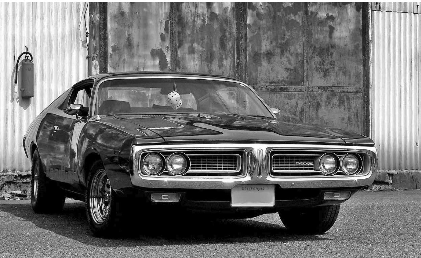
Örök forma – Tökéletes állapotban lévő 1971-es Dodge Charger 383 Magnum napjainkban

hez és népszerűségvesztéséhez, majd veszélyesen közel került ahhoz, hogy egyszerűen kiesik az időből. A deep state a fejekben van. Miután a jobboldal (ahol nem a magyar jobboldalról van szó) átvette ellenfele gondolkodásmódját, ezzel már félig vereséget is szenvedett. Ez az önkéntes szellemi kolonizáció a konzervatív gondolkodás elbizonytalanodásával és dezertálásával párhuzamosan zajlott – például a progresszív szókészlet elfogadásával, a „liberális minimum” meg nem kérdőjelezésével és egy ki sem kényszerített megfelelési kényszer kialakításával (ennek örök hazai emlékműve marad a Heti Válasz ). Ezzel szemben hosszú, de sikeres forradalommal ér fel a konzervatív szellem önfelszabadítása, a jobboldali tudat dekolonizációja. 4 A politikai siker ennek híján lehetetlen, és ezzel együtt is csak lehetséges, hiszen ez csak az alapot biztosítja hozzá. Aki ellenfele feje után megy, biztosan veszít, aki a sajátjával, annak (csak) esélye nyílik győzni. Nincs olyan, hogy lefutott meccs!