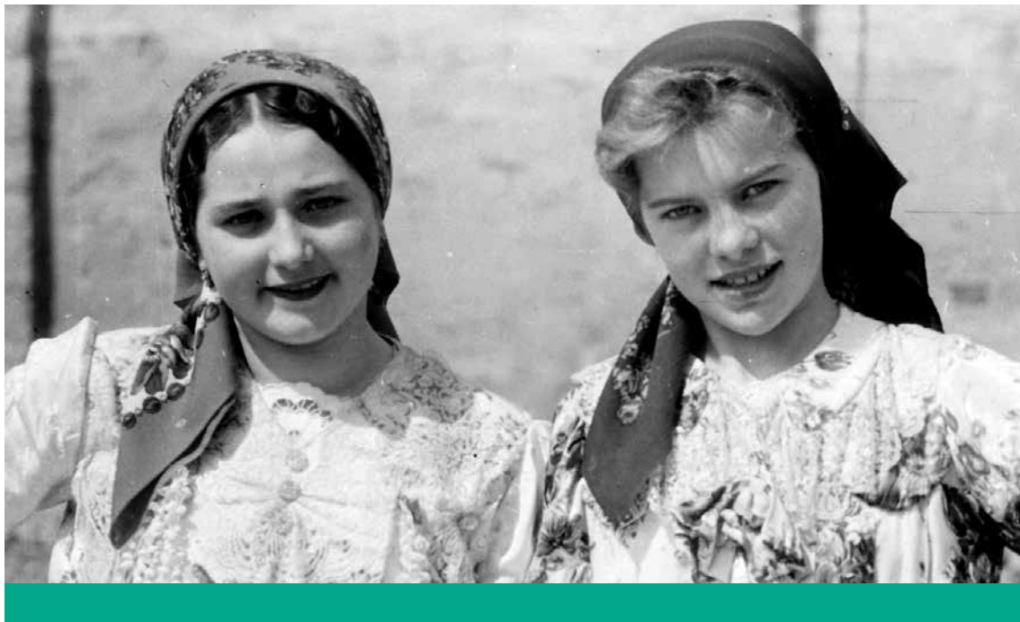
Helyi hagyomány – Népviseletbe öltözött lányok egy decsi (Tolna megye) lakodalomban, 1962

likánusok győztek, míg a „populista párt Coloradoban és Kansasban [!] nagy vereséget szenvedett” – nyilván a kongresszusi képviselő-választásokon, hiszen elnökválasztás nem volt ebben az esztendőben.