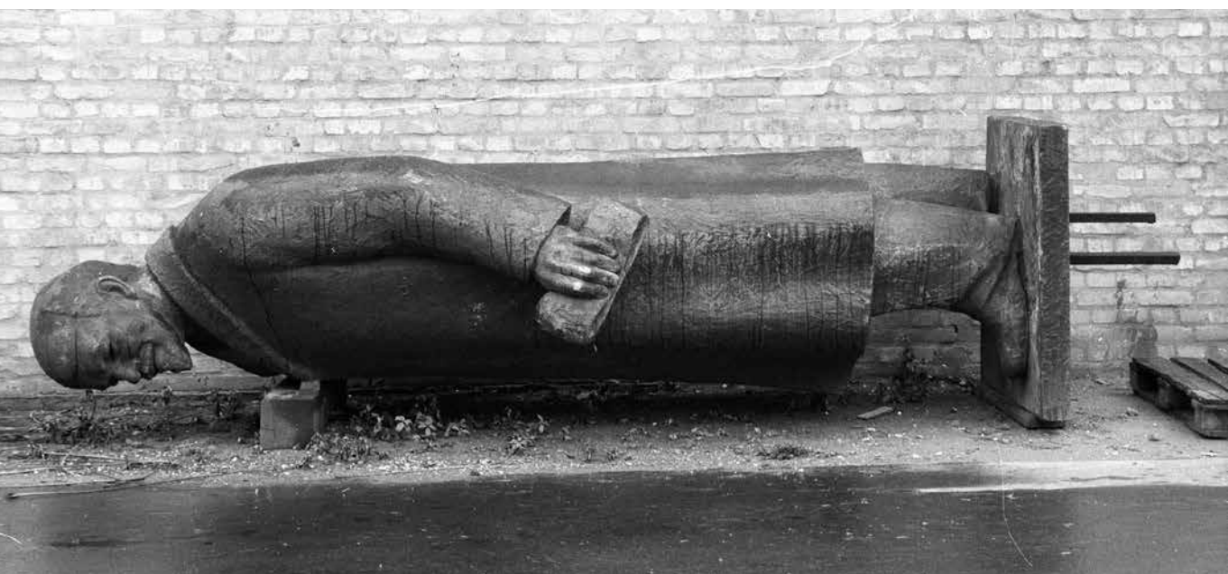
Rendszerválság – A Sztálin-szobor helyén felállított, majd 1990 nyarán leszerelt Lenin-szobor (Pátzay Pál, 1965)

nem törekszem a téma átfogó feldolgozására – az itt bemutatottnál jóval nagyobb és szerteágazóbb a témával foglalkozó irodalom. Cikkem tehát pusztán illusztratív jellegű. S még valami: az alább bemutatandó szerzők inkább a régió általános jelenségeire koncentrálnak, semmint külön egy-egy országra. Így Cas Mudde és Erin Jenne írásán kívül nincs közvetlen magyar fókuszú cikk. Ha a nyugat-európai politológusok bemutatott cikkei korlátozottan érintik is Magyarországot, mégis nagy tanulságokkal szolgálhat számunkra az a megközelítésmód, amelyet általánosságban alkalmaznak.