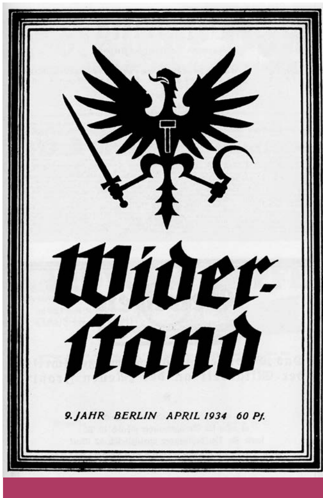
Konzervatív forradalmárok – Ernst Niekisch Widerstand (ellenállás) című nationalrevolutionär (nemzetiforradalmi), náciellenes folyóiratának címlapja az utolsó, 1934-es évfolyamból

Fontos még megemlítenünk Ernst Niekisch író, újságírót, aki a Die Widerstand című folyóirat főszerkesztője volt. Niekisch a nemzeti bolszevizmus szellemi vezetője volt, elképzelése szerint egy német–oroszi egységet kellett volna létrehozni, és így megdönteni a francia–angol hatalmi monopóliumot. Támadta a liberalizmust és ostromozta a nyugati gondolkodást: „Nyugatosnak lenni annyit jelent: a szabadság frázisával csalást elkövetni, az emberiséghez történő hűségességgel bűnököt elkövetni, a nemzetek békéjét meghirdetve népeket tönkre tenni.” Hitler hatalomra kerülése után nyíltan ellene fordult, amiért 1937-ben letartóztatták és 1939-ben életfogytig tartó börtönrre ítélték. Letartóztatása előtt egy ideig Ernst Jünger is bűjtatta. 1945 után Berlin szovjet zónájában telepedett le, tagja lett az SED-nek (Sozialistische Einheitspartei Deutschlands – Német Szocialista Egységpárt, a kelet-német állampárt) is, és a kommunista rendszer felépítését támogatta. 1953 után észlelte a szovjet rendszer végzetes hibáit és írásaiban bemutatta a működő kommunizmus hiányosságait, a pártból 1955-ben kilépett. 1963-ban áttelepült Nyugat-Berlinben, ahol emlékiratain dolgozott, amely két kötetben jelent meg Egy német forradalmár emlékezései címmel. 25