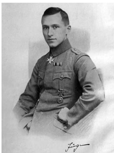
Ernst Jünger (1895–1998) 1921-ben