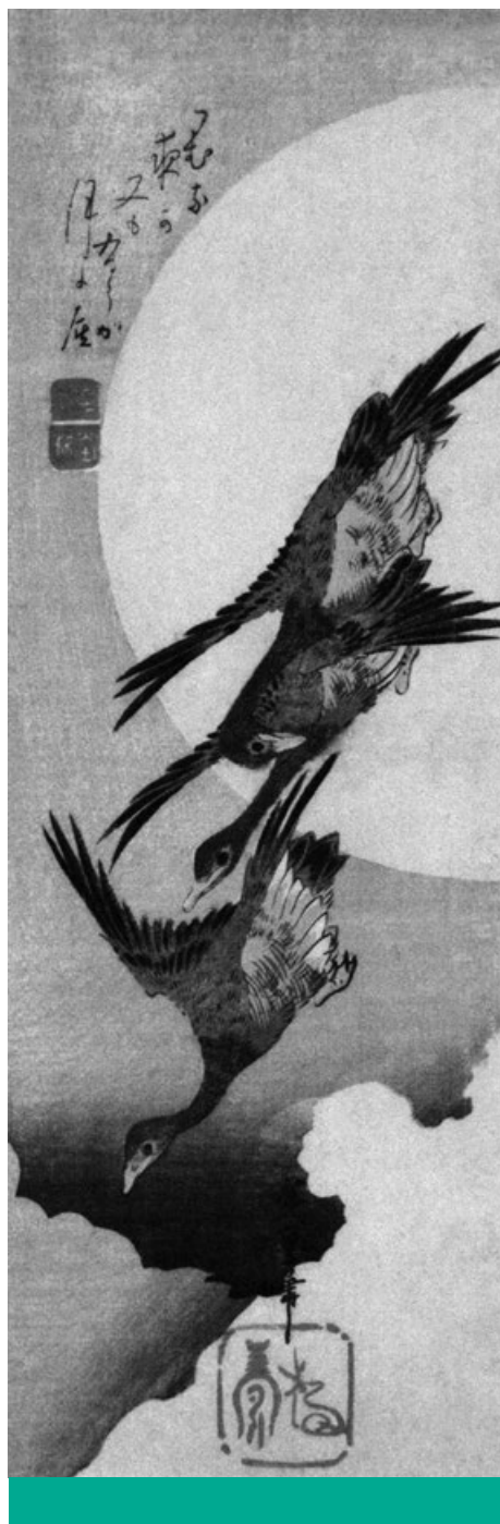
Organikus harmónia – Utagawa Hiroshige: Vadludak repülnek a Hold előtt (1832–35) (San Diego Museum of Art)

Az oikosz szó – melyből az „öko” előtag örökölt meg az „ökológia” (és más, hasonló) szavunkban – eredeti jelentése „otthon, háztartás, család”. Az etimológia megvilágítja, hogy a környezet- vagy természetvédelem valójában az otthon (haza) és a család védelme. Következésképp egyetlen családvédelmi program sem igen képzelhető el a természet és a társteremtmények védelme, az egészséges környezet megőrzése nélkül. Ezek szétválasztása nem a konzervatív, hanem a világ egységét dekonstruáló baloldali gondolkodás sajátosságaira utal. Mindebből az is következik, hogy az élelmiszeriparban alkalmazott, gyakorta egészségtelen adalékanyagok, a naponta használt mérgező vegyszerek, a természet használatának mai módzatai aláássák egy valóban konzervatív ökológia alapjait, mert a világ töredezettségéből fakadó ágazati logikában gondolkodnak, az összefüggéseket pedig elhomályosítják, a kölcsönös felelősséget elhárítják. A fragmentáltság logikája szerint a gyomirtók használata csupán az agrárium ügye; a vizek állapota a vízügyé; az erdőkért az erdőgazdálkodás felel; a városok levegőjének minősége városstratégiai kérdés; a biodiverzitás csökkenésének megakadályozása a természet-