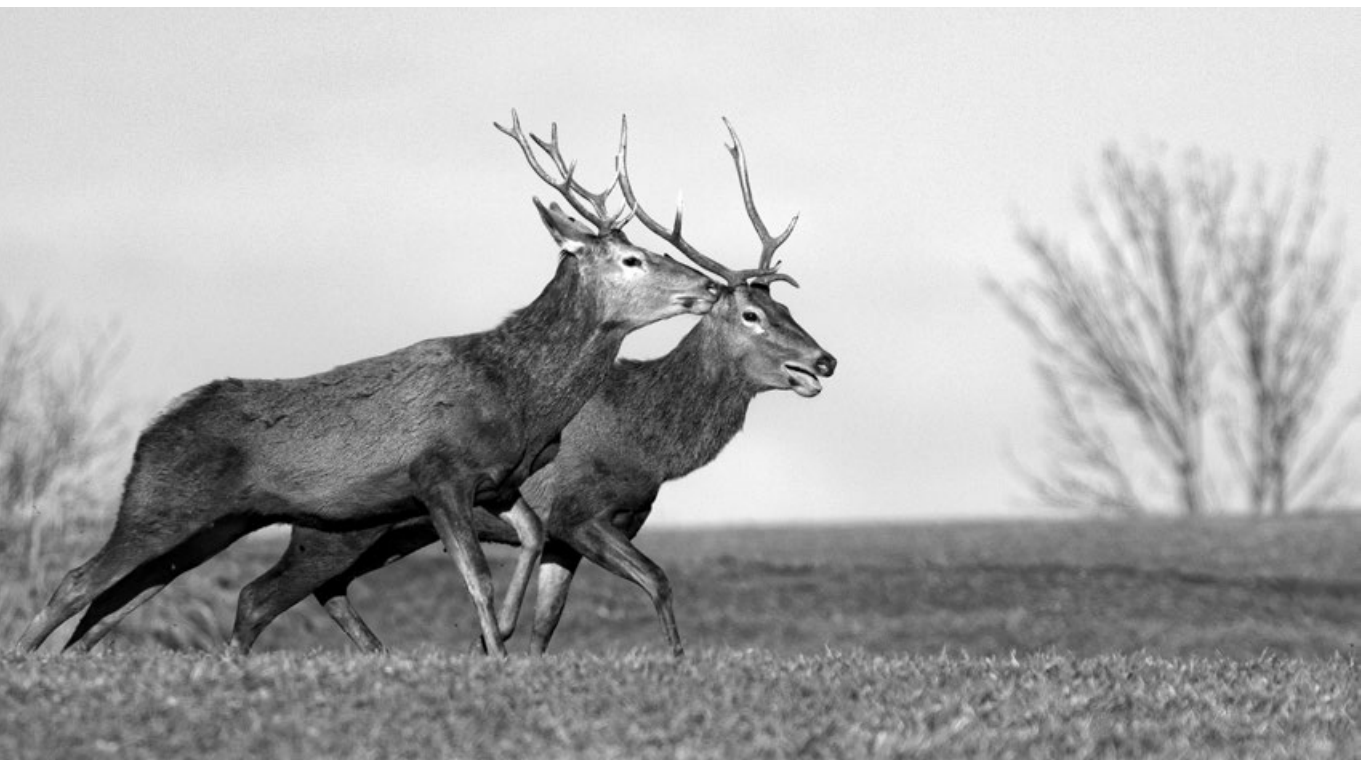
Párosan szép – Szarvasok Nagyesztergár (Veszprém megye) határában, 2018. január

erőforrásokat, műveli a földet, osztja el a megtermelt javakat. Mindezek működésében és hatásaiban az ember nyilvánul meg. Jól csak akkor működhet a felépítmény, ha jó az is, aki mozgatja. Az ember és környezetének viszonyrendszerét kell tehát átértékelnünk, új szemléletet, megközelítéseket, a helyes értékeket kell létrehoznunk.