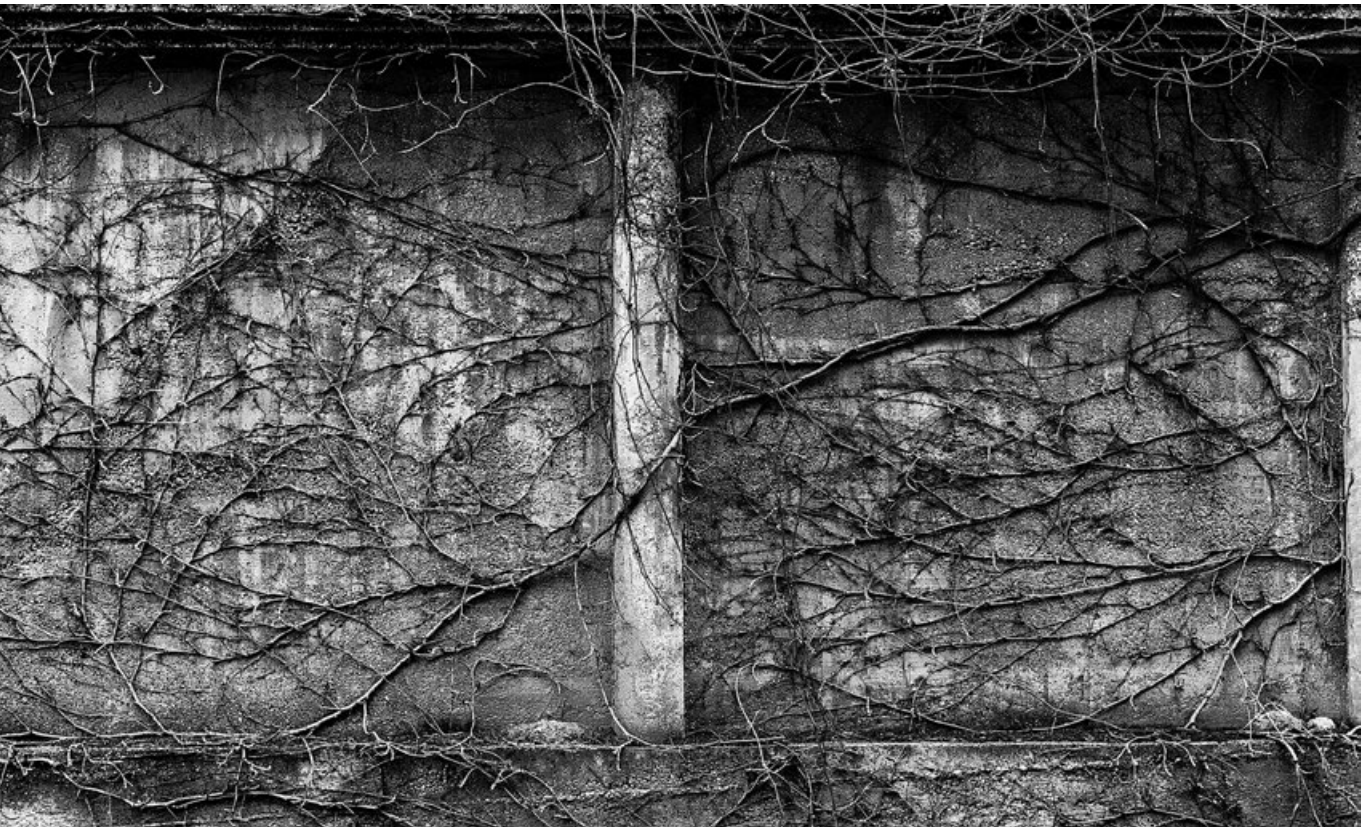
Természetes gyökerek – Téli életkép Veszprémben, 2018

a „lélegeztető gépnek” a fenntartása egyre több környezeti erőforrást igényel és már egy ideje meghaladta azt a szintet, amelyen természeti javaink képesek lennének megújulni.