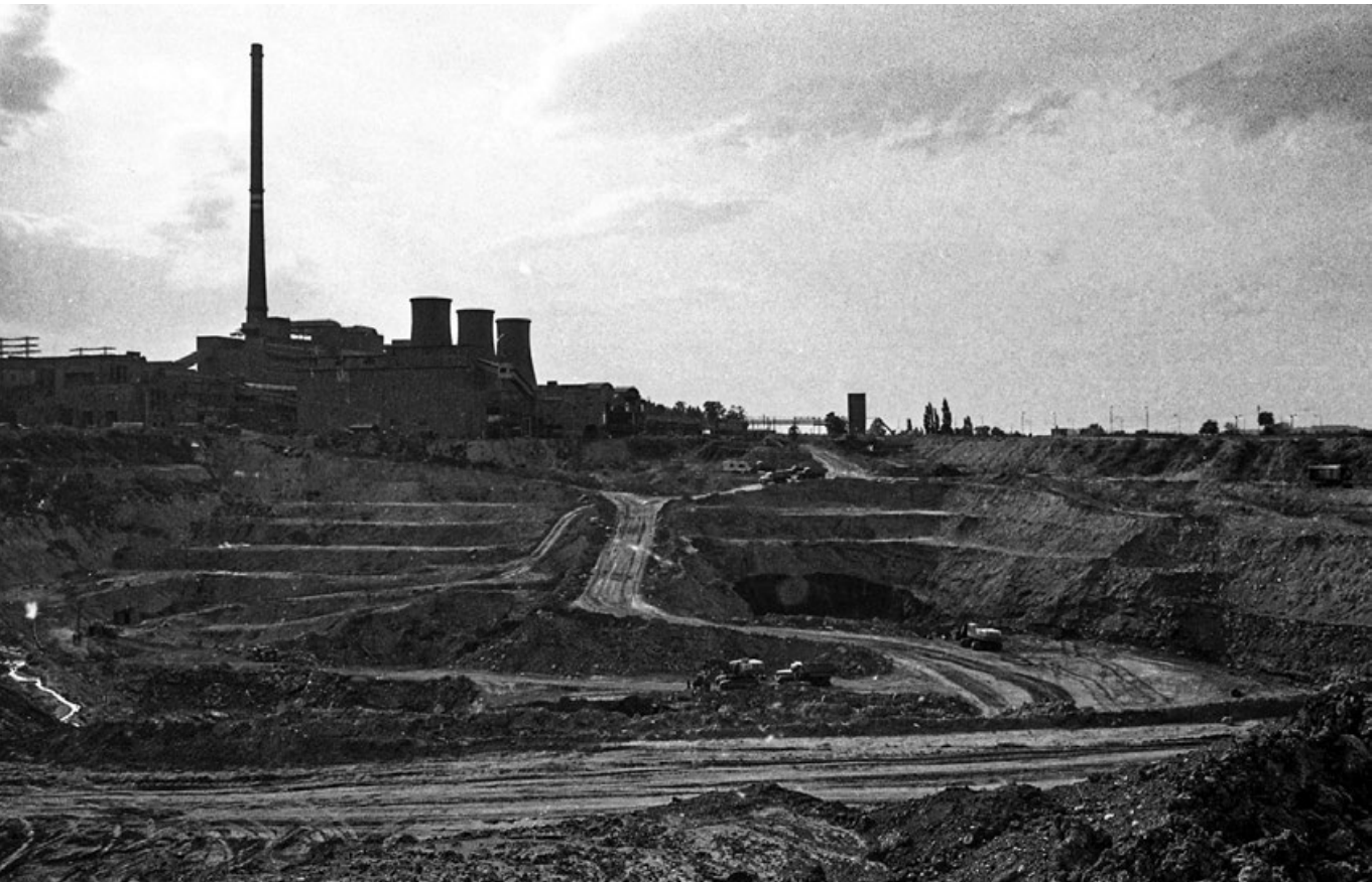
Tájseb – Tatabányai külszíni fejtés, 1983

megismételhető kísérleteken nyugvó bizonyítás, vagyis elég logikai és filozófiai síkon igazolni egy állítást. Az elgondolás nem rossz: ha kiiktatjuk a tudományt és az empiriát, bármit állíthatunk. Csakhogy akkor azt is el kell fogadni, hogy mindennek a tagadása is egy lehetséges és ugyanolyan létjogosultsággal rendelkező narratíva. A kommunista diktatúra nem adta meg egykor ezt a lehetőséget, az ellenvéleményt szibériai száműzetéssel jutalmazták, ma szakmai ellehetetlenítés és általános megvetés jár érte. Kizárólag a diktatúrák sajátja, hogy bármiféle tudományosnak mondott gondolatot egyetlen és kizárólagos igazságként fogalmazzon meg, ezzel korlátozva a tudomány és a szólás szabadságát. Ma a gender -tanok elárasztják a világhálót és a médiafelületeket, létrehozva egy alternatív valóságot, amelyet tilos megkérdőjelezni vagy bármiféle tudományos vizsgálatnak alávetni – nincs szükség bizonyítékra, a hit tökéletesen elég.