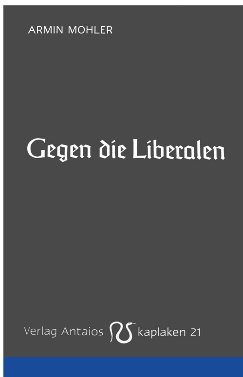
Armin Mohler: A liberálisok ellen ([posztumusz] 2010)