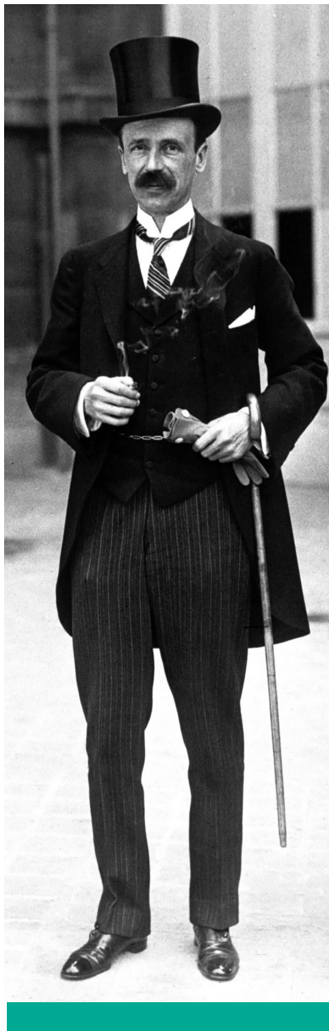
Államférfi – Gróf Bethlen István 1923-ban

Reálpolitikai megfontolásai nemcsak a numerus clausus fentebb ismertetett 1928-as módosításának keresztülvitelében voltak tetten érhetőek, hanem például a királykérdés körül kialakított álláspontjában is. Bethlen ugyanis a lelke legmélyén legitimista volt, viszont tisztában volt azzal, hogy a Habsburg-dinasztia restaurációjára az I. világháborúban győztes antanthatalmak, valamint a kisantant államok egyértelműen elutasító hozzáállása miatt nincs lehetőség. Ehelyett megalkotta az ún. „nemzeti királyság” elméletét, amivel belpolitikai szempontból taktikusan megválaszoltalanul hagyta az uralkodó személyének kérdését, s ezt legitimista, illetve szabadkirályválasztó szemszögből is értelmezni lehetett. 45 Miként 1922 tavaszán kifejtette: „mi nem azt mondjuk, hogy legyen király, mert akkor lesz újból ország, hanem mi azt mondjuk, hogy legyen először ország, mert ha lesz ország, akkor majd lesz olyan király ennek a nemzetnek, mint amilyet követel.” 46