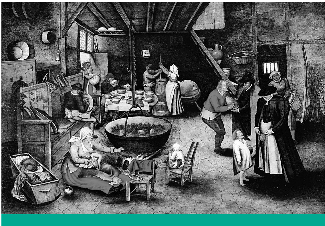
Régi rend I. – Ifjabb Pieter Bruegel Látogatás a parasztgazdaságban (1622) című festménye

egészségi eredményekhez kapcsolódik”, így „orvosi szakértők szerint a döntésnek valószínűleg katasztrofális következményei lesznek a transzfiatalok mentális egészségére”. 24 A transz nemű jogvédők szintén felháborodtak a döntésen, és elítélték a törvényjavaslatot, mondván, hogy az „veszélyeztetné a transz nemű gyermekeket”, ugyanis szerintük „elszörő bizonyíték van arra, hogy a transz nemű és nembináris fiatalok identitásukban való megerősítése csökkenti az öngyilkossági kockázatot, és javítja az egészségüket is”. 25 Táborukat sajnálatos módon sokszor maguk az egészségügyi szakemberek is gyarapítják, akik a nemi identitás zavarban szenvedő gyermekek szüleit a kezelések elfogadására buzdítják. 26 Mindezek ellenére további 16 állam veszi fontolóra az arkansasihoz hasonló döntés meghozatalát.