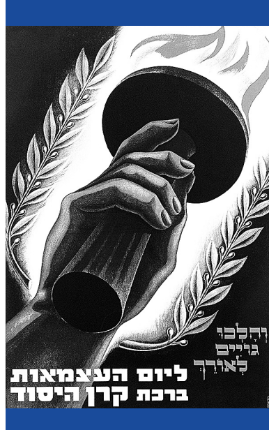
Nemzet születik – Cionista plakátok Izrael megalapításának idejéből: zsidó csillagot leszakító katona, kivándorlásra való buzdítás, Izrael függetlenségi napjának köszöntése