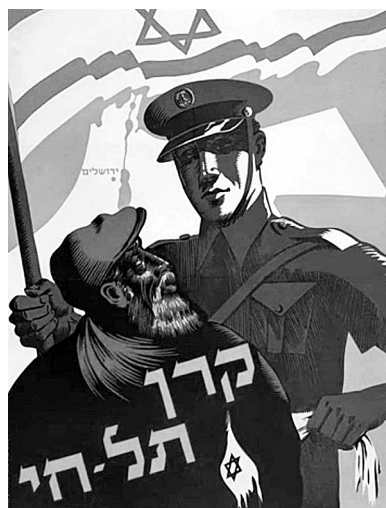
בופעל חנוכה תש"ג

Véleményem szerint a demokratikus intézmények egyetemes elfogadásának fő oka a zsidó nemzeti hagyomány rendkívül demokratikus jellege. Izrael történelmi hagyománya – mint nemzet, amely az Egyiptomból való kivonuláskor született és nemzeti törvényét a Szináj-hegyen kapja, nem egy szent prófétától, angyaltól vagy apostoltól, hanem közvetlenül a Seregek Urától – azt jelenti, hogy teológiailag és filozófiailag soha nem volt komoly igény az Isten által jóváhagyott törzsi vagy arisztokratikus hierarchiára a zsidó kultúrán belül. Még akkor is, amikor a zsidó társadalmat meghatározta a judaizmusra való áttérés, a második templom