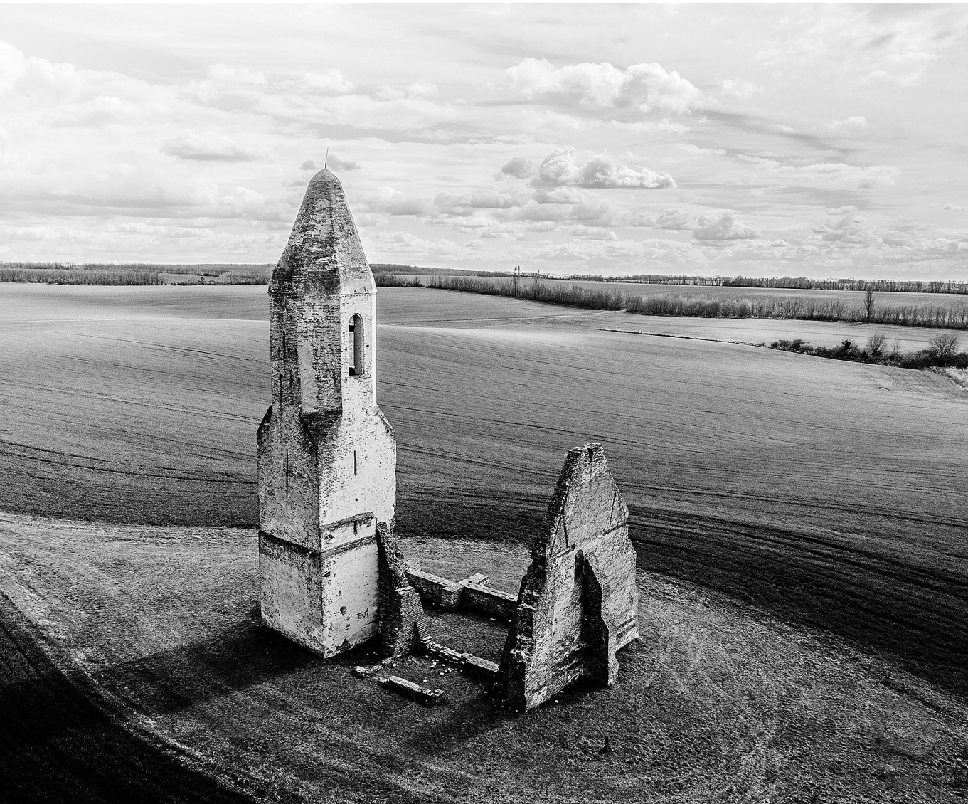
A puszta közepén – Templomrom, 2019