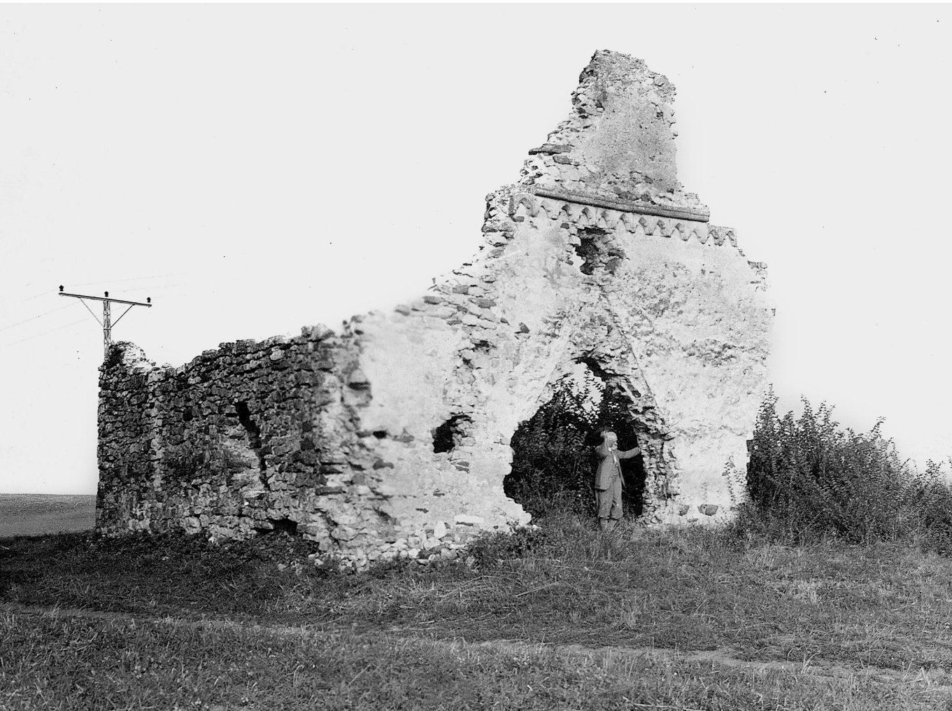
Most kóhalom – A kövesdi templomrom a Tihany melletti Aszófő határában, 1936

akadályozó, szebb megfogalmazás szerint kockázati tényezőnek tekintették, úgy a termőföld kérdésköre sem kapott különösebb figyelmet. Most, hogy az élelemtermelés a háborús következmények miatt ismét elsőrendű alapkérdés lett, talán ebben is lesz némi elmozdulás, és a legjobb minőségű termőföldeken nem feltétlenül fognak gyárakat, szennyező üzemeket vagy épp napelemparkokat létesíteni. Hasonlóképp remélhető, hogy a beruházásokat szabályozó most készülő törvénytervezet kiter majd a régészeti lelőhelyek hatékonyabb védelmére is. Addig is a művelési ágak megváltoztatása, a célzott területek szántásból való kivétele, a kiemelt védelmet érdemlő régészeti lelőhelyeken való rét, mező, legelőterületek kialakítása lehet a közös nevező, mely minden tekintetben előnyös megoldást hoz a problémák kezelésére.