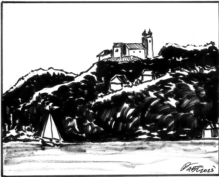
Közösség, hagyomány, szabadság – Fábán István illusztrációja (2023)