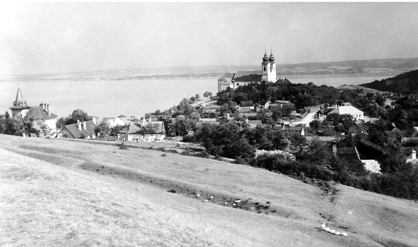
Tihanyi távlat – A bencés apátság az Attila-dombról, 1928

tosabb, hanem hogy egyben legyünk és kitartsunk egymás mellett, bármilyen nehézség ellenére is.