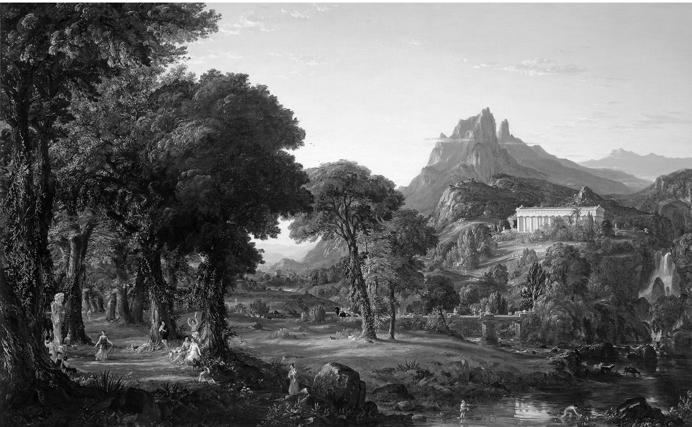
Pásztorállam – Thomas Cole négyrészes Birodalom -ciklusának első darabja, az Árkádia (1836)

világ nem lehetséges. Az uralmat, a hierarchiát és a jogot, ha megdöntik, nem valami boldog-csudálatos örök Woodstock követi, hanem egy újabb uralom, egy másik hierarchia és új jog. Azoké, akik megdöntötték az előzőt, ez pedig sokszor nagyságrendekkel rosszabb, mint amit megdöntöttek. Lenin nem eltörölte a zsarnokságot, hanem a saját zsarnokságát építette fel a megdöntött cári uralom helyére. A seattle-i „tanácsköztársaság” nagy egalitárius utópiája másnapján egy Raz Simone nevű hadúr vette át a hatalmat a fekáliától büzlő, önellátásra képtelen, élelemből kifogyott antiállamban. Nem választották, hanem átvette az uralmat, a természetes állapotok márpedig távolról sem egyenlőségelvűek. Valójában tehát az uralomtól, hierarchiától és jogtól való eloldódásunkkal a sajátunk helyett egy mások által gyakorolt uralom, hierarchia és jog irányába haladunk.