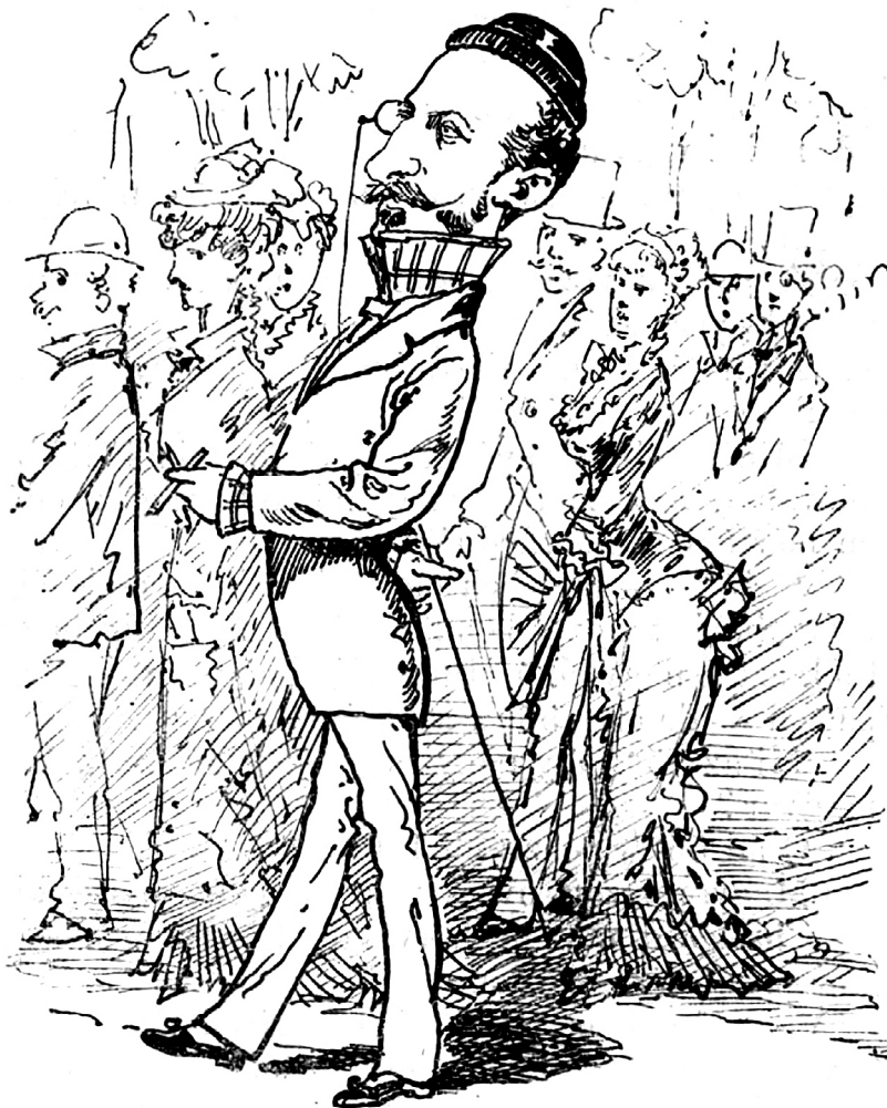
Fontolva haladás – Asbóth János (1845–1911) a Dunakorzón (Borsszem Jankó, 1879. augusztus 10. 6. oldal)

volna a nemzetre „rádisputálni a liberalizmust”, ha Kossuth nem ismeri fel, hogy „az európai liberalizmus a legerősebb, az egyetlen szövetséges Ausztria ellen” – jegyzi meg ugyanott.