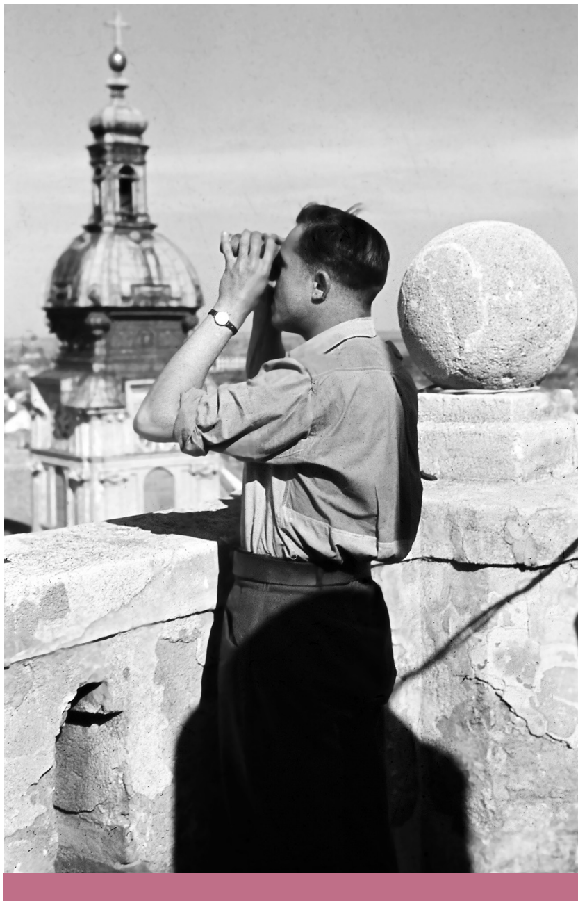
Keresztény szemlélet – Légi megfigyelő a győri Püspökvár tornyában, háttérben a székesegyház tornya

kihez. Az, hogy ő most kicsi, én pedig nagy vagyok, az a véletlen műve, ami lehet, hogy holnapra éppen fordítva lesz. Többször hallottam egyik-másik gyerektől olyasmiket, hogy majd amikor ő nagy lesz, én meg kicsi, akkor elvisz engem az állatkerthbe, illetve amikor ő nagy volt, én meg kicsi, akkor már egyszer el is vitt. Az egyik fiam például váltig állította, hogy amikor ő nagy volt, akkor tudott lovagolni, olvasni, úszni – amiből nem is mindent felejtett el mostanra, hogy kicsi lett. Például egyszer, amikor uszodában voltunk, kijelentette, hogy tud úszni. Megkérdeztem tőle, hogy mikor tanult meg, mire azt mondta, hogy még nagyon régen, és magabiztosan gyalogolt be az egyre mélyülő medencébe. Már a feje tetejét is ellepte a víz, amikor kihúztam. Azt hittem, sírni fog, de nem. De hiszen én nem tudok úszni! – kiáltotta prüszkölve, őszinte megdöbbenéssel a hangjában. Számára ez volt az a pillanat, amikor rájött, hogy mi, emberek, nem egyszerűen azok vagyunk, akik lenni szeretnének, nem egyszerűen pszichológiai akaratok vagyunk, hanem épp ellenkezőleg, van egy eredendő természetünk, amelyet nem lehet a végtelenségig büntetlenül megtagadni. Abban pedig biztosak lehetünk, hogy ez a „De hiszen én nem tudok úszni!”-pillanat egyszer mindenki életében elkövetkezik, gondoljon most bármit is a technológia fejlődéséről. Csak ki kell várni. ■