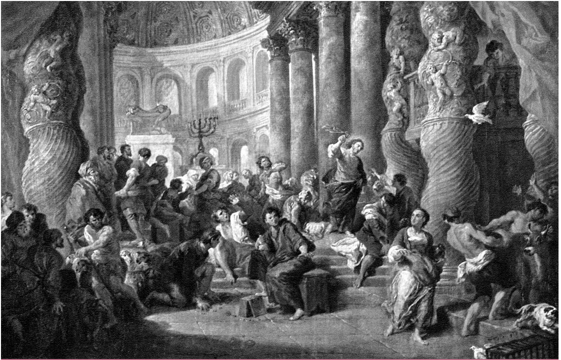
Féltőn szerető – Giovanni Paolo Pannini: Krisztus kiűzi az uszorásokat a templomból (1750) (Wikimedia Commons)

Ha figyelembe vesszük, hogy ezeket a regényeket szinte falták a vallásos neveltetést kapott polgári olvasók, akkor azt mondhatjuk, hogy az amerikai közvélemény jó része nyitott volt a keresztény és szociális elvek összeegyeztetésére. A fenti regények és a szociográfiai irodalom, valamint az amerikai lelkipásztorok egy részének hatására különösen a középosztálybeli fiatalok és a nők hajlottak arra, hogy elmenjenek a szegénynegyedekbe, hogy önkéntes karitatív munkát vállaljanak. A katolikusok és a protestánsok között húzódtott a korszakban a fő vallási törésvonal. A katolikusok bizonyos mértékig helyzeti előnyben voltak: megtűrt vallásuként eleve érzékelték, mit jelent a kirekesztés, s náluk az egyház az egyetlen közösségfenntartó intézményként jöhetett számba. A protestánsok felekezeti, sőt egyházközösségi alapon fragmentáltak voltak, a materializmus és az individualizmus pedig jobban beférközött a soraikba. Ezért érdemes külön vizsgálni a két nagy vallási csoportot.