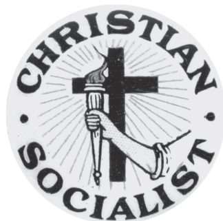
Amerikai keresztényszocialista jelvény száz évvel ezelőtt

A Social Gospel mozgalom aktív kereszténységet hirdetett, és ösztönözte a segítségnyújtást a nagyvárosi elmagányosodott emberek, gyermekek, munkanélküliek, hajléktalanok részére. Jane Addams honosította meg angol mintára