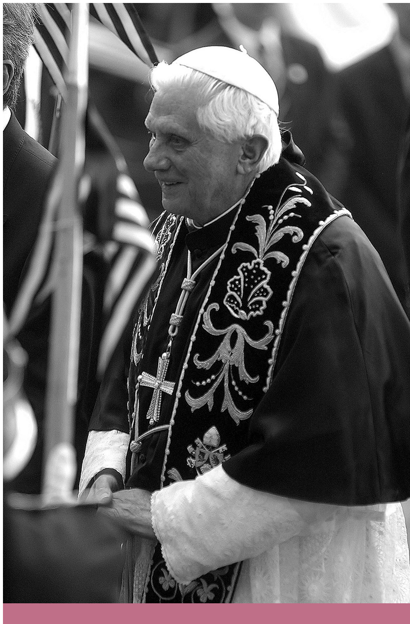
Világkereszténység – XVI. Benedek pápa a brazíliai São Paulóban, 2007

gyökereitől” 26 . Másrészt, ahogyan arra Ratzinger rámutatott a Habermasszal folytatott 2004-es vitában, ahogy a vallásokat is olykor át kell világítani az ész fényével, úgy „az ész is figyelmeztetni kell a hatáira, és az észnek is nyitottnak kell lennie az emberiség nagy vallásos hagyományaival szemben” 27 . Harmadrészt pedig, mindennek a tétje, hogy képes-e az ész befogadni egy olyan objektív igazságot, ami megelőzi és egyúttal meg is haladja egy magasabb egységben a mérhető és kiszámíthatót. A ratzingeri felfogásban ugyanis a politika kitüntetett célja az igazságosság. 28 Objektív igazság nélkül az igazságosság alapvető kívánalma sem tud teljesülni, hanem minden személyes és társadalmi döntés egyaránt relatív lesz. Közvetlenül megválasztása előtt így fogalmazott Ratzinger: „A relativizmus diktatúrája van kialakulóban, amely semmit nem ismer el, ami végleges, és egyedül saját akaratát és vágyát teszi meg mértéknek.” 29 A „relativizmus diktatúrája” nem elvont filozófiai okoskodás, nem valami távoli