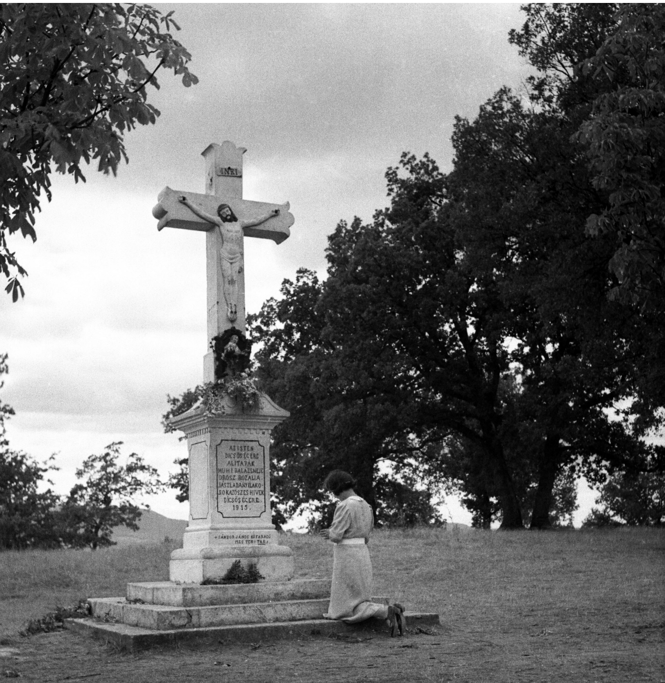
Keresztény alázat – Falusi fészület előtt térdeplő nő, 1935

disztópia rémképe, hanem az újkor óta velünk élő európai sorskérdés. Ezért az újkorban megcsonkított ész teljességét helyre kell állítani, hogy a politika önnön célját be tudja teljesíteni.