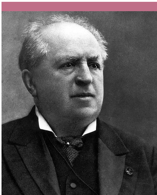
Abraham Kuyper (1837–1920)