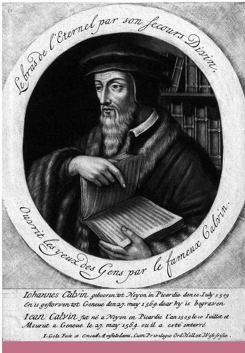
Genfi polgár – Kálvin János (1509–1564) 17. századi ábrázolása

denkor figyelnie kell arra a veszélyre, melyet az állam léte önmagában hordoz, s amely a személyes szabadságra nézve problémás lehet. A világ létezésének, benne az emberiség létének és benne a nemzeteknek, népeknek a célja a kálvinizmus egyik alapelve szerint az, hogy Isten dicsősége mutakozzon meg bennük. Isten dicsőségét kell szolgálnia az egész teremtett mindenségnek, benne az emberi nemzetekkel és népekkel, az emberek szerveződéseivel és az emberek cselekedeteivel együtt.