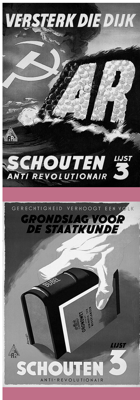
Konzervatív kálvinisták – A holland Forradalomellenes Párt választási plakátjai az 1948-as választások idején

Kuyper egykori, neves magyar követője Sebestyén Jenő (1884–1950) kifejtette, hogy az állampolgárnak állampolgári felelőssége, kötelességei és jogai egyaránt vannak. Ahogyan a kálvinizmus megfogalmazásában Isten az embereket munkatársaiává hívja el, hogy életük során neki szolgálva, életükkel az ő dicsőségét