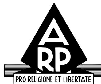
A holland Forradalomellenes Párt emblémája

Ezekből a gondolatokból táplálkozott a 19. században Abraham Kuyper református lelkipásztor is. Ő alapította 1879-ben a holland Forradalomellenes Pártot (Anti-Revolutionaire Partij), melyet az első keresztyéndemokrata jellegű pártként tartunk számon. 5 Parlamenti képviselő, illetve 1901 és 1905 között Hollandia miniszterelnöke is volt, aki hirdette és meg is valósította a gyakorlatban azt, amit kálvinista keresztyénként a politikáról vallott. 6