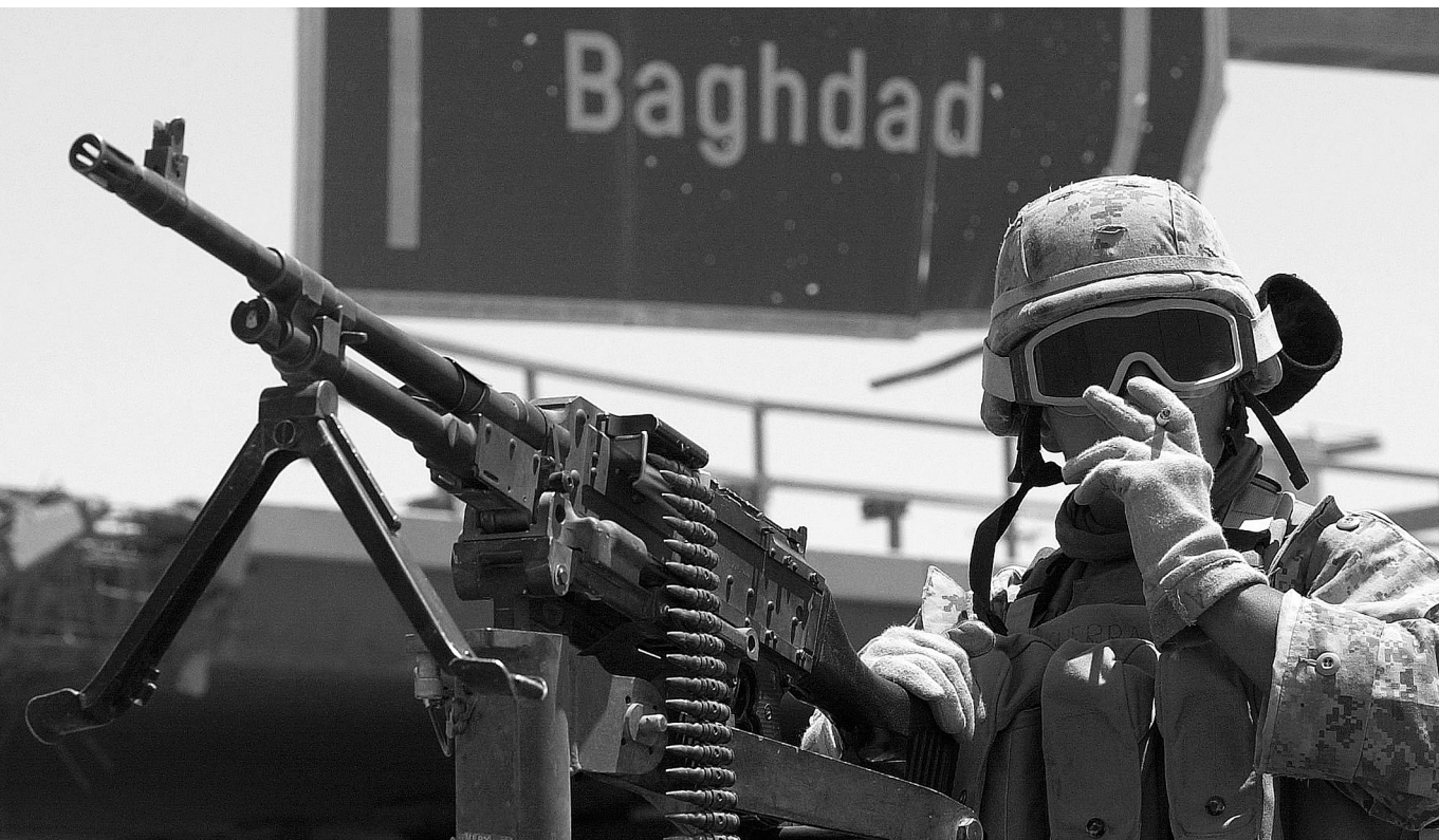
Menetelő korszellem – Amerikai katona Bagdadnál, 2003