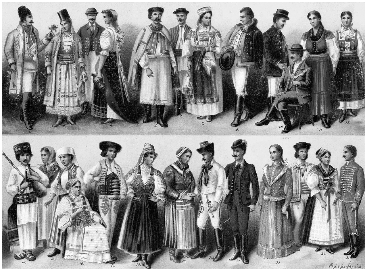
1. 2. Erdélyi sasos mátkapár. 3. Gömörvármegyei pár. 4. 5. Kalotaszegi népviselet. 6. Hétfalu csángó férfi. 7. 8. Torockói népviselet. 9. Székely. 10. Szász. 11. Székely leány. 12. Hétfalu csángó leány. 13. V. székely román. 14. Aradvármegyei (vadászi) leány. 15. V. székely román asszony. 16. Szász asszony (Krausz-Szilágyi várm.). 17. 18. Pétervárdi tót férfi és leány. 19. 20. Temesvármegyei (vingal) bolgárok. 21. 22. Sashegyvármegyei (nyitregyházi) férfi és leány. 23. Gömörvármegyei tót férfi. 24. 25. Szepesi asszony és férfi.