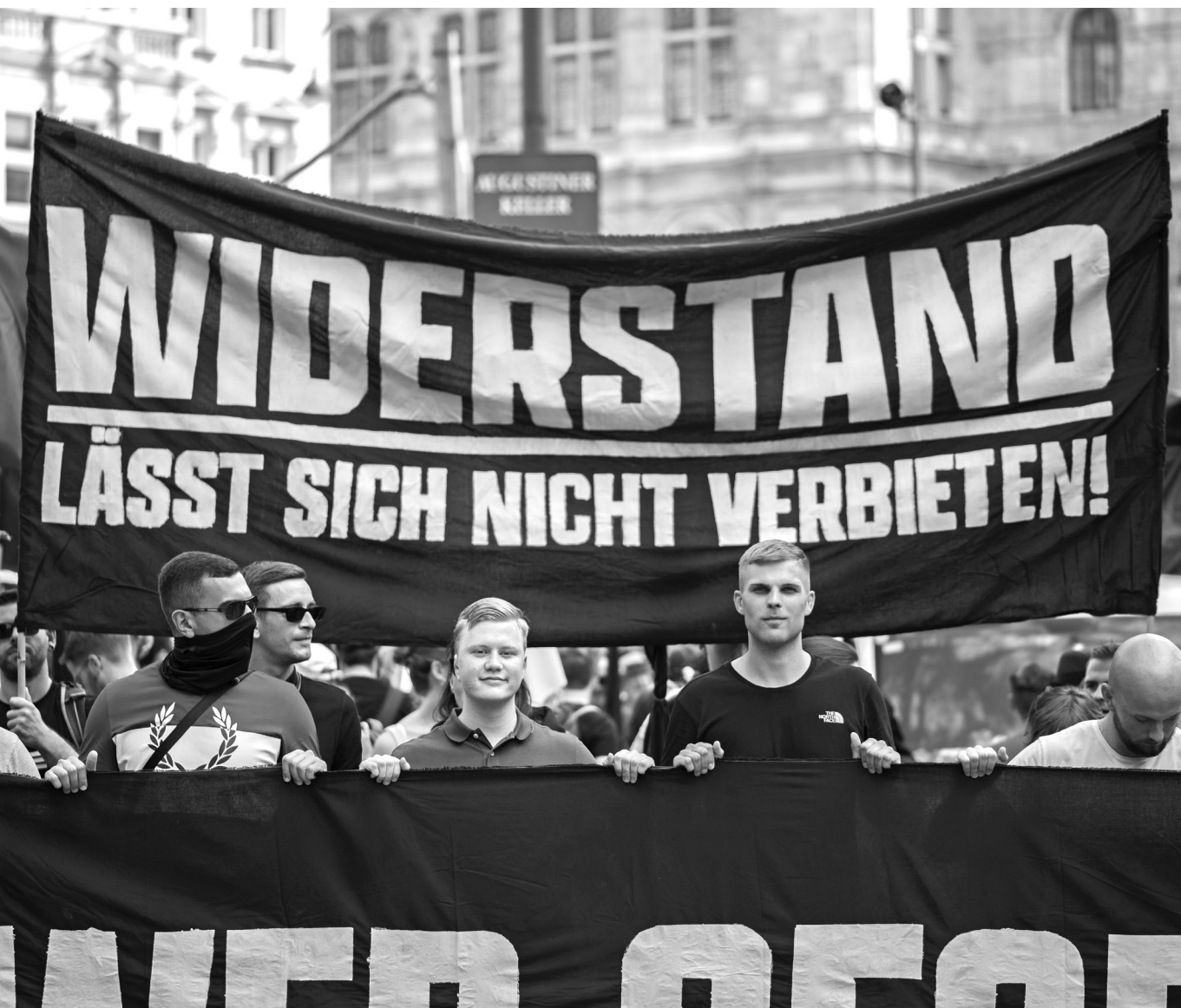
Európai öntudat – Az osztrák Identitárius Mozgalom tüntetése Bécsben, 2021. július 31.