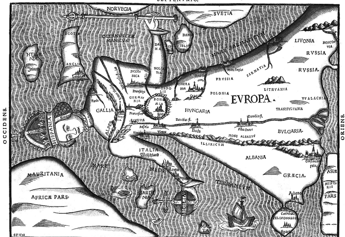
En tibi, formose sub forma Europa puellæ Vitula fecundus pandit vit illa sinus.