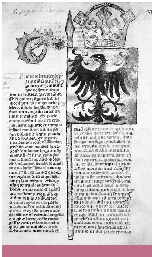
A Német-római Birodalom zászlaja a Livro de Aurotos című portugál címerkönyvben, 1416–17 (Wikimedia Commons)

Carl Schmitt, akitől az előbbi idézet származik, a „politikainak” olyan definícióját adta, amely erős affinitást mutat Elias túlélési egység fogalmával. Schmitt esetében a politikait nem más szférákkal szembeállítva, kizárólagosan kell meghatározni, hanem az arra jellemző kritérium alapján. Ez a kritérium az emberek végső elkülönülése, vagyis nem más, mint a barát–ellenség oppozíció legradikálisabb kifejeződése. 28 Ahogy Elias túlélési egysége, úgy Schmitt