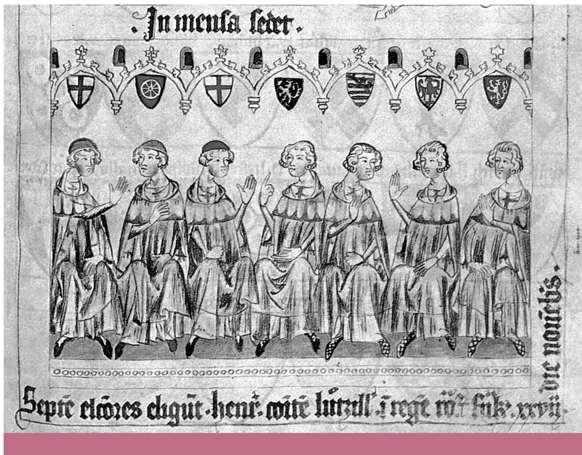
Európai bizottság – A hét választófejedelem VII. Henrik német-római császár megválasztásakor Frankfurtban, 1308. november 27-én

Politische -fogalma is az emberek elválásának és az ezáltal létrejövő csoportok egységének legintenzívebb foka. Szintén közös pont a két gondolkodóban, hogy szerintük a társulás és széthúzás során kialakuló egységek között a fizikai harc nem alapvető, azonban a háború lehetősége és ezáltal a kölcsönös fenyegettség mindig adott, ahogy a kulturális idegenség is.