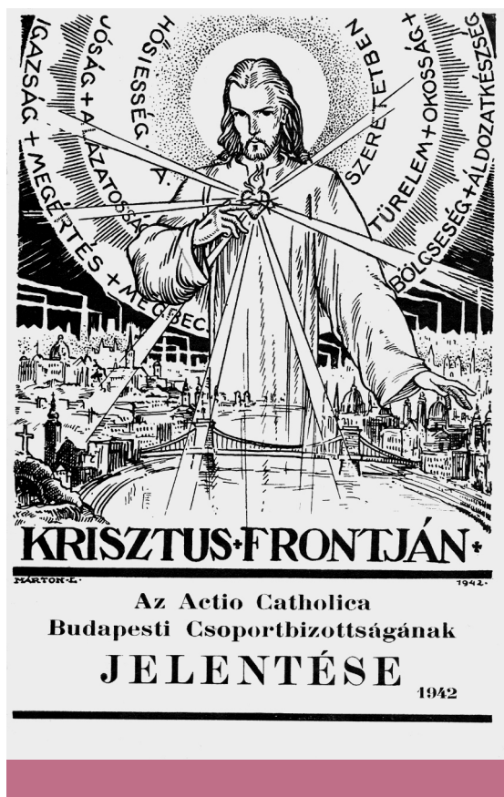
Szociális kereszténység – Az Actio Catholica Budapesti Csoportbizottságának 1942. évi jelentése és 1946-os, demokráciáról szóló konferenciájának kiadványa