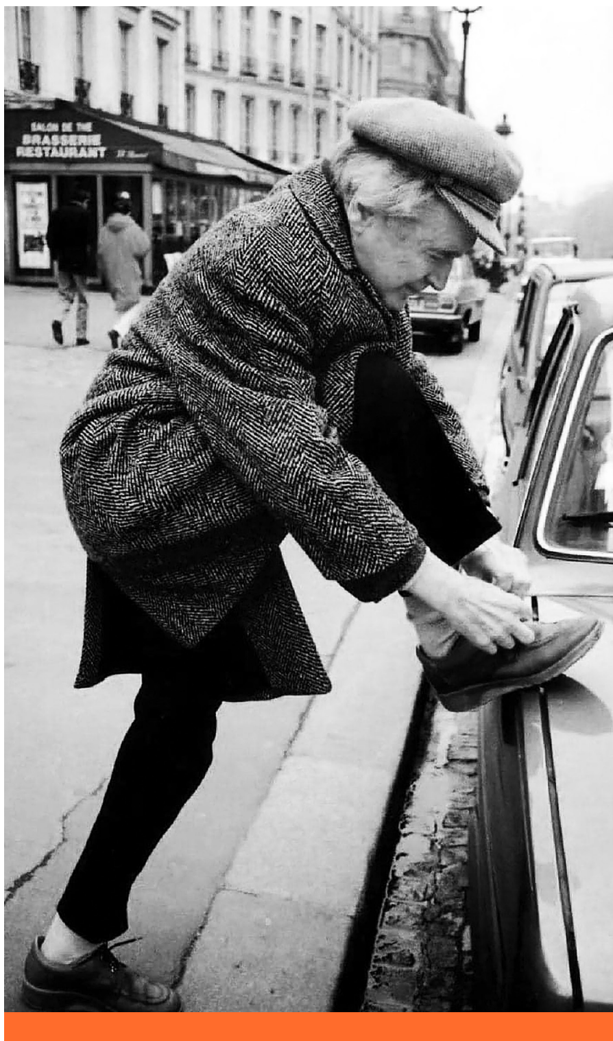
Emil M. Cioran (1911–1995) Párizsban

nehezményezi a királyi többségek gyakori használatát. A kulcs Cioranhoz szerint az, hogy ő egy olyan író, aki „megőrizte a komoly intellektuális tevékenység látszatát, azonban abszolút elsőbbséget ad a retorikai gesztusoknak, a verbális extravaganciának és a divatos provokatív pózoknak”. Emellett Kimball szerint Cioran retorikai csele, hogy teljesen bevett – politikai, kulturális vagy etikai – bölcsességeket fordít ki intellektuálisan, és ezzel sokkolni, provokálni próbál. Sontagot kiegészítve, aki a nietzschei hatásra hívja fel a figyelmet (amit Kimball ellentmondásosnak tart, és szerint Cioran nem tanítványa, hanem csak tökéletlen utánozója), Kimball a romantika szemléletével rokonítja Ciorant, akár mint egy „rimbaudi figurát”, akár mint az ösztönt az intellektus fölé helyező gondolkodót. Az aforizmáit pedig egy „olvasott, de mélyen felkavart